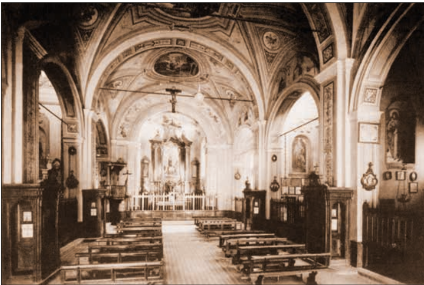
Cartolina d’epoca. Interno del santuario

Una consegna che mantiene anche oggi tutto lo spessore e il senso di una autentica devozione a Maria che l’umile frate cappuccino delle benedizioni, proclamato ora Venerabile dalla Chiesa, fa risuonare ancora nel santuario mariano di Casalpusterlengo, testimone e custode della sua santità.