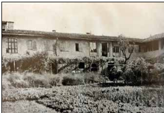
Bergamo, il Convento visto dall'orto (1800), foto d'epoca Fra Carlo fu a Bergamo come studente di filosofia (aprile 1855)

La Positio , infatti, enumera appena nove manoscritti-autografi del servo di Dio padre Carlo Maria dal primo biglietto, diretto all' Amorossissimo Sindaco (15 ottobre 1850), al nono: Esercizio di eloquenza , databile tra il 1855 e il 1858, l'anno prima del suo beato transito, avvenuto nel convento di Casalpusterlengo, il 21 febbraio 1859. Accostare questi scritti, fa notare acutamente il suo appassionato biografo fra Evaldo, "E' quasi un poter guardare padre Carlo dal di dentro, dal suo stesso spirito", cioè da un punto di osservazione privilegiato ci viene spontaneo aggiungere, che costituisce una sorta di full immersion nella sua anima. Le coordinate della spiritualità del cappuccino