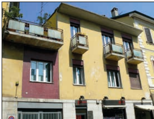
Abbiategrasso. Casa natale del servo di Dio

Infine, dopo aver visitato la mostra, abbiamo raggiunto la Chiesa di San Pietro per ammirare la suggestiva opera a pastello del pittore Antonio Martinotti, raffigurante un padre Carlo che, oltre a benedire i fedeli che lo circondano, benedice anche i fedeli che osservano il dipinto.