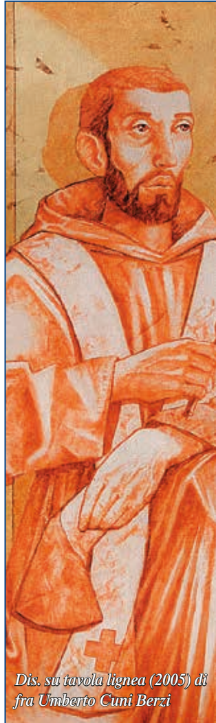
Dis. su tavola lignea (2005) di fra Umberto Cuni Berzi

- I fedeli hanno stimato il Servo di Dio in vita perché vedevano in lui un esperto in umanità con il dono della consolazione , capace di accogliere, ascoltare, rassicurare con parole e gesti semplici. Dalla sua biografia si deduce - dai suoi pochissimi manoscritti, dai suoi pensieri e soprattutto dalla deposizione dei testi - che egli derivava tale attitudine verso i poveri e i deboli da un particolare forte riferimento alla Trinità, alla Passione di Cristo crocifisso