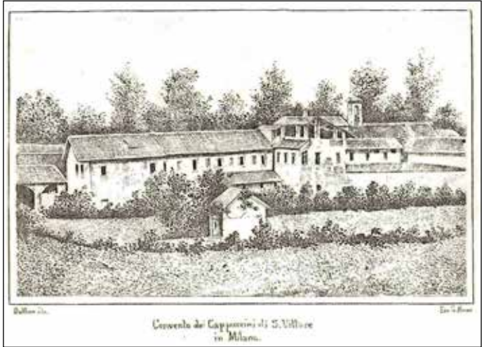
Convento di San Vittore all’Olmo (Milano)

“All’incominciar che faccio della presente, subito intendo muovere le membra convenienti in tal effetto nel Nome del Divinissimo nostro