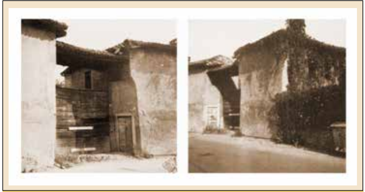
Abbiategrasso Ruedi dell'antico convento dei Cappuccini

Quel che Dio vuole, lo voglio anch’io! Ma