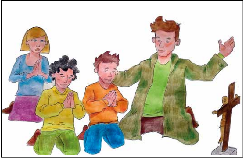
“Insegno a pregare Dio Amore”

E ancora, sento forte in me San Francesco che mi suggerisce di farmi aiutare a diffondere il Vangelo. Chiamo attorno a me altri giovani ferventi che collaborano e condividono le mie attività di apostolato e di dono. Ciò diviene motivo di fare sempre il “primo passo”, di affiancarmi ai bisognosi, senza prevalere ma