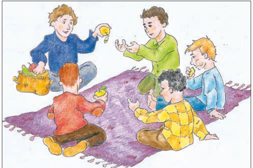
A scuola distribuiva ai più poveri il cestino della sua colazione