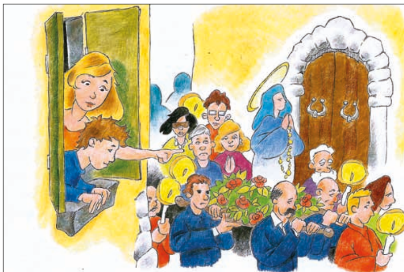
A cinque anni partecipa dalla finestra alla grande processione in onore della Madonna e guarisce

Quando vado in chiesa con la mamma e il papà, mi sento tanto felice e cerco il Tabernacolo, dove Gesù vive nell’Ostia, “prigioniero