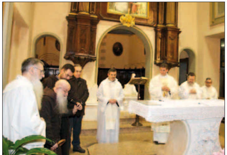
nelle foto: alcune istantanee della Consegna della Relazione