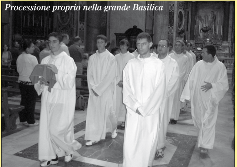
Processione proprio nella grande Basilica